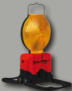
Euro-Blitz compact Synchro

Durch die neue horizont SMART-Synchro Technologie sind unterschiedliche Warngeräte der Produktfamilie untereinander kompatibel und können daher gemeinsam verwendet werden.