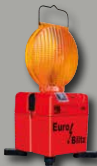
Euro-Blitz LED Synchro