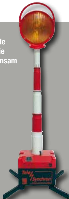
Tele-Blitz LED Synchro